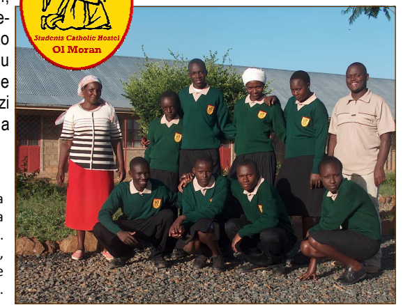
Kulia juu: Sherehe ya mwaka 2010, Askofu Luigi alipofungua rasmi Hekima House.