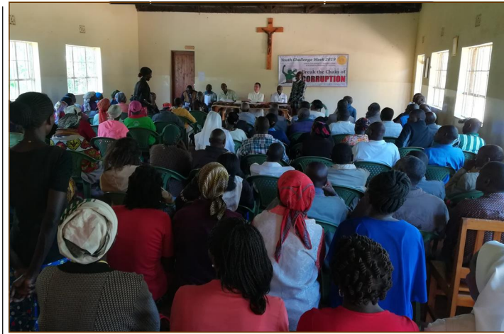
Juu: Viongozi wa Parokia nzima walipokutana katika Parish Assembly ya 14, OI Moran, tarehe 18 Januari.

Baada ya Parish Assembly, Viongozi wa Makanisa Madogo walikutana tena Jumamosi 29 Februari, katika Zones nne za Parokia, kwa ajili ya Semina kuhusu uongozi wa Kikanisa.