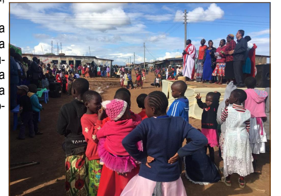
Kulia: Wachungaji pamoja na washirika wa Makanisa kijijini OI Moran.

Tena, siku hiyo haikuwa ya maneno tu, bali kama ishara ya ushirikiano katika kazi ya huruma, Wakristu walichangia kwa nia moja mradi wa watoto wa Nyumba ya Magnificat, wanaopokelewa na Masista wetu.