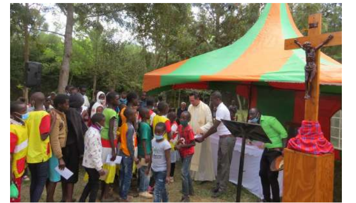
Juu: PMC Baraka Day, wakati wa mchango, Jumapili 6 Juni.