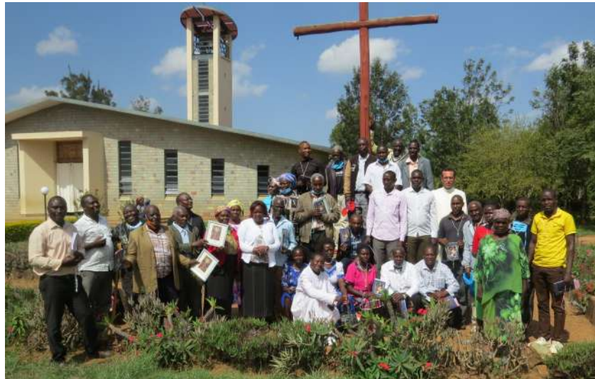
Chini kulia: Makatekista Wazee waliosherehekeka.