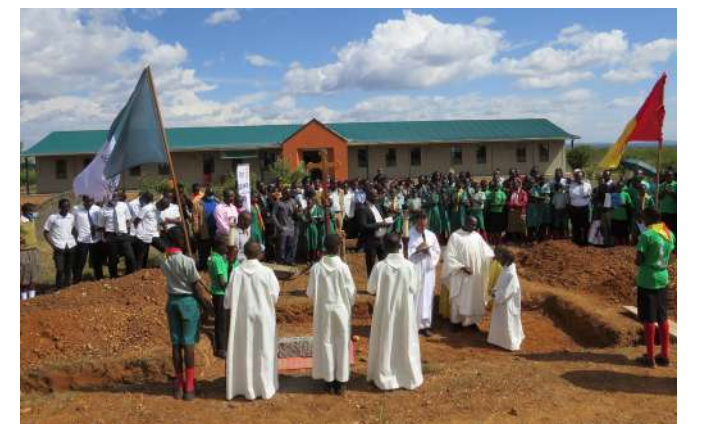
Chini: Sherehe ya uzinduzi wa bwani la kwanza la Tumaini Academy.