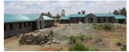
Juu: Maendeleo ya mijengo ya Tumaini Academy