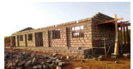
Chini: Ujenzi wa Madarasa ya Dam Mbili