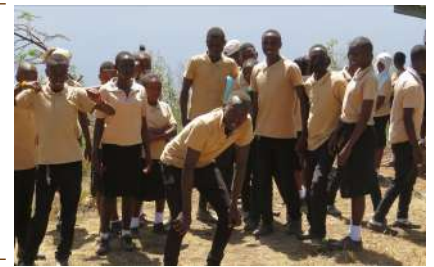
Juu: Safari ya Wanafunzi wa Hekima House